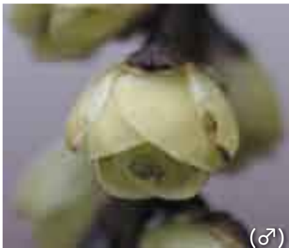
たくさんの花が垂れ下がっているよ！ (♂)