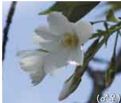
島の花見はやっぱりこれでしょう！ (♂♀)