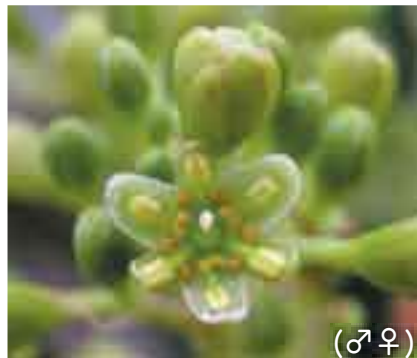
この木の皮で黄八丈の樺色を染めます。 (♂♀)