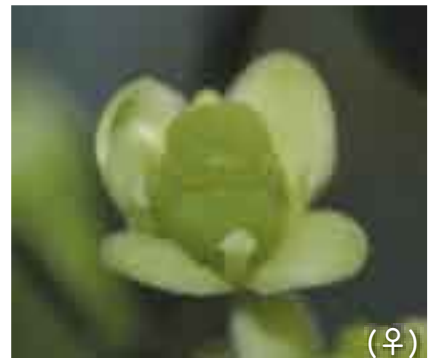
樹皮から鳥もちが作れるらしい。 (♀)