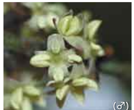
葉は細く長く、花は密集して咲いています。 (♂)

「アカコッコ」とは日本固有のツグミ科の鳥で、国の天然記念物にも指定されています。八丈島では一年を通して見られ、町の鳥にも選定されています。