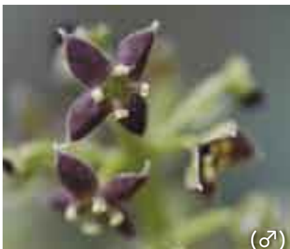
同じ名前のいます？ (♂)