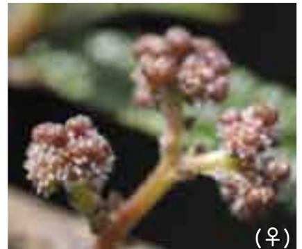
ミカン色の小さな実がたくさんあります。 (♀)