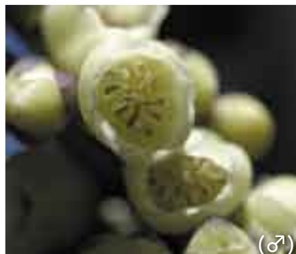
神事によく使いますね。 (♂)