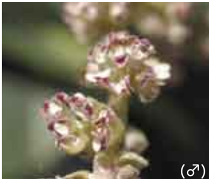
おいしい実がなる木。 (♂)